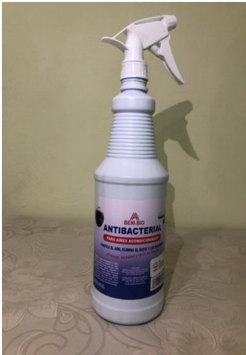
Caja 12 Unidades de 32 Oz