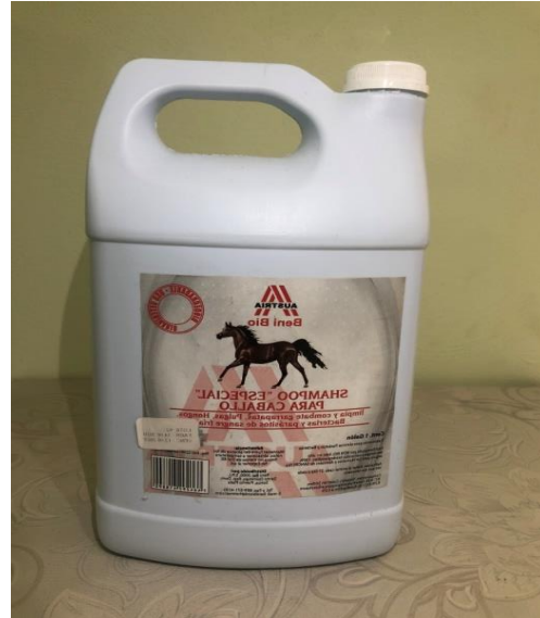
Caja 4 y 6 Unidades de 1 Galón

Champú para caballos | contra ácaros, pulgas y hongos | alivia eficazmente el picor y favorece el proceso de regeneración | sistema para un efecto duradero. Este champú fue desarrollado para caballos, pero también es seguro, suave y muy eficaz para los humanos.