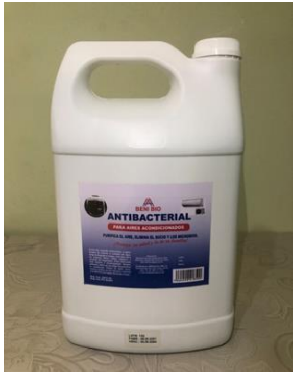
Caja de 4 y 6 Unidades de 1 Galón

Para Desinfectar y Limpiar los Aires Acondicionados prevenir Bacterias, Viren, Hogos etc.