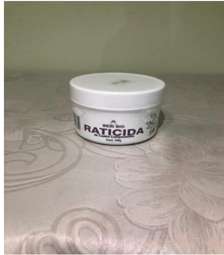
Caja 20 Latas de 150 Gram

Potente raticida de cuatro componentes, efectivo contra roedores. Se recomienda colocar varios tarros de sebo en diferentes partes donde caminan los roedores. En caso de que necesite dividirla porción use otro recipiente limpio y use una cuchara desechable (destruya la cuchara antes de votarla en un sitio fuera del alcance de los niños.