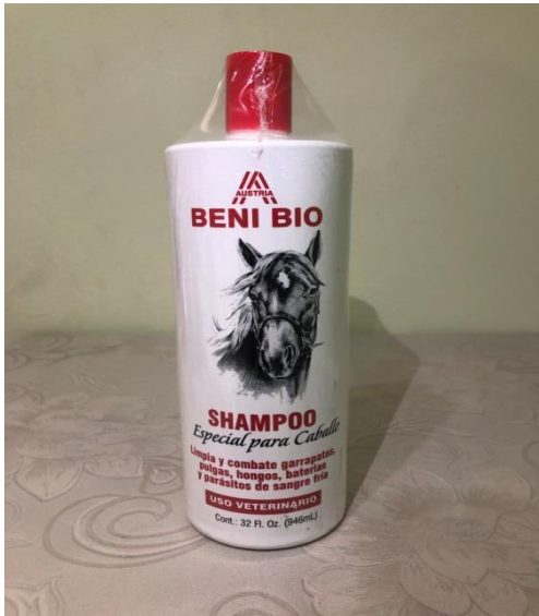
Caja 12 Unidades de 32 Oz