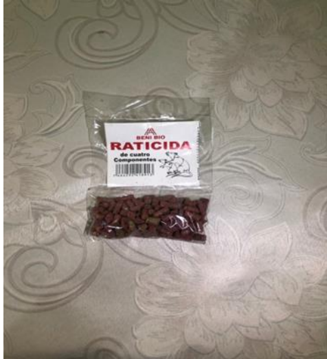
Caja 30 Sobre de 40 Gram